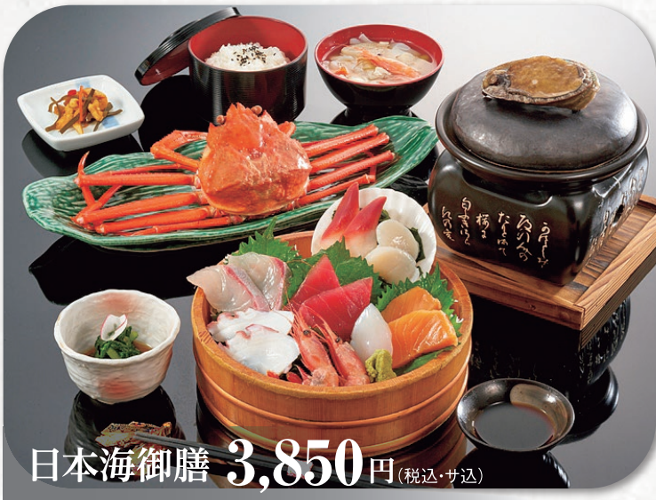
日本海御膳 3,850円 (税込・サ込)