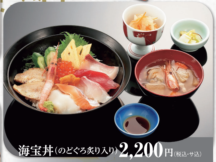
海宝丼(のどぐろ炙り入り) 2,200円 (税込・サ込)