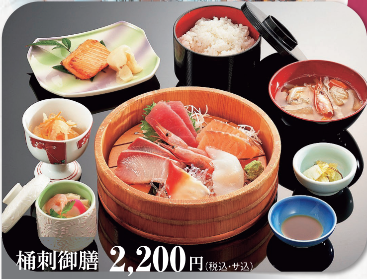
桶刺御膳 2,200円 (税込・サ込)