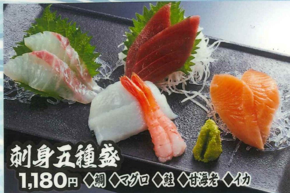
刺身五種盛 1,180円 ◆鯛 ◆マグロ ◆鮭 ◆甘海老 ◆イカ