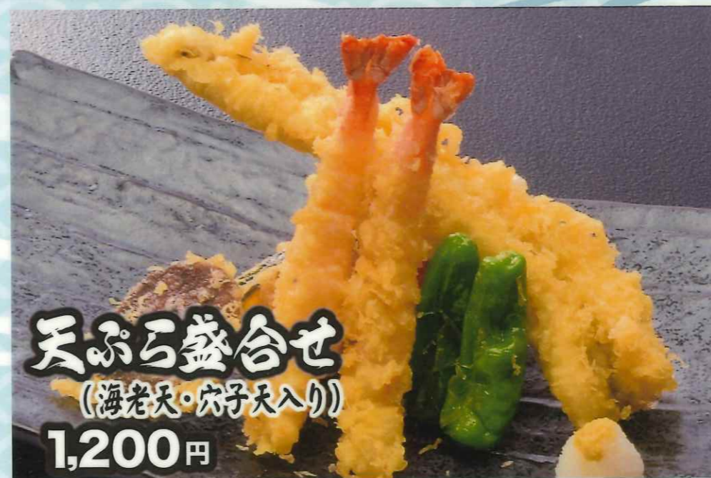
天ぷら盛合せ (海老天・穴子天入り) 1,200円