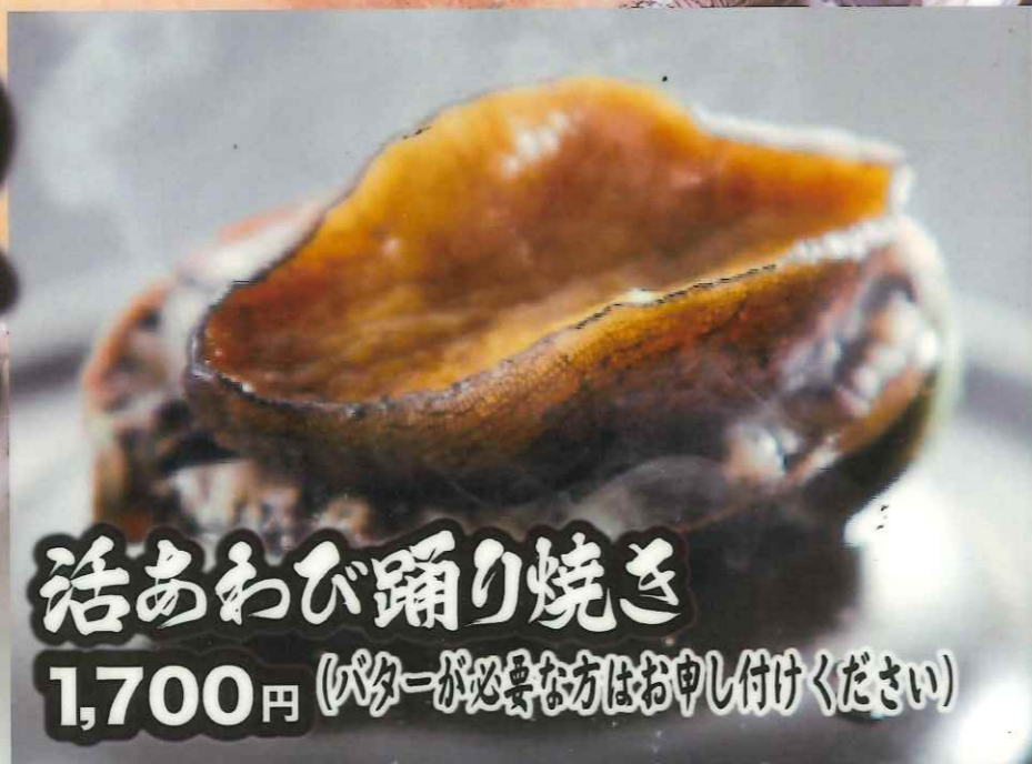
活あわび踊り焼き 1,700円 (パーティーが必要な方はお申し付けください)